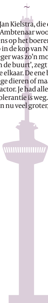
Euromast 185 meter