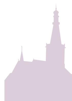
Bonifatiuskerk Medemblik 71 meter