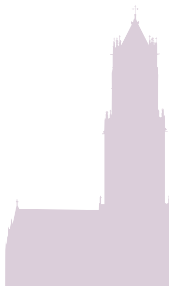
Utrechtse Dom 112 meter